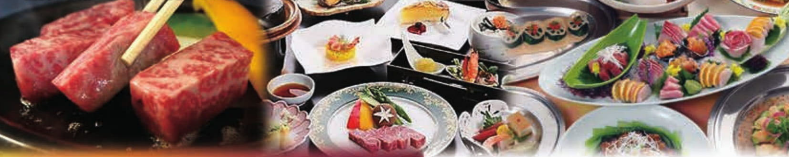
写真の料理はイメージ。団体様のタイプにより内容はご相談いたします。