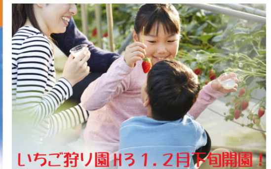
いちご狩り園H31.2月下旬開園!

宿泊の方 平日+5,500円・休前日+6,500円 [朝食付] *和室1室3名様より、洋室1室2名様ご利用時の料金です。 *和室1室1~2名様利用時はお一人様+1,000円にて。